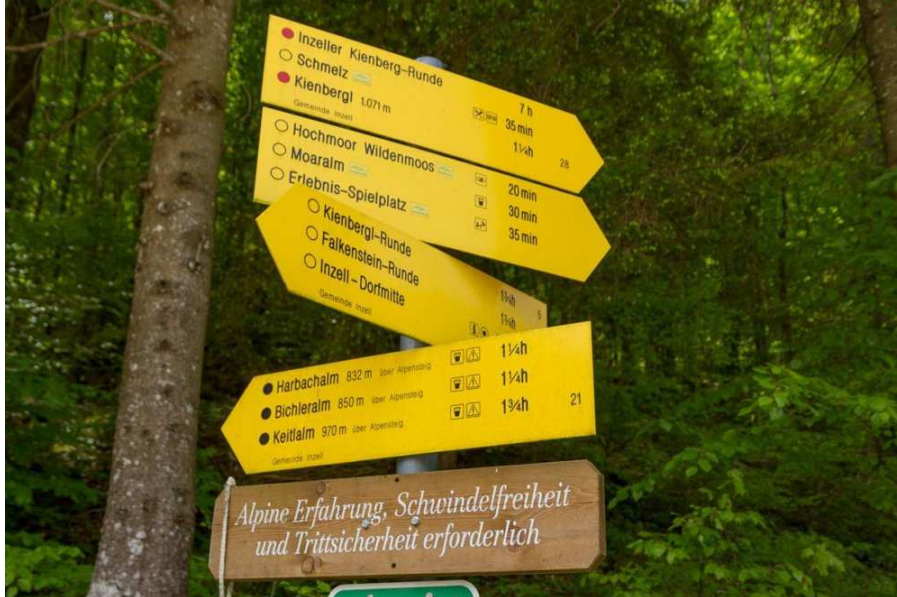
Chiemgauer 100 Meilen 2017, Alpine Erfahrung, Schwindelfreiheit und Trittsicherheit erforderlich.