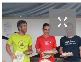
4. Die 100 Meilen

Während das 100 km Rennen insgesamt langsamer als in den Vorjahren war, blieb der 100 Meilen Sieger unter der magischen 24 Stunden Marke und erzielte damit eine Top-Zeit. Damit